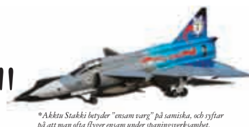
*Akktu Stakki betyder "ensam varg" på samiska, och syftar på att man ofta flyger ensam under spaningsverksamhet.