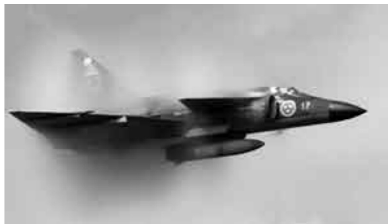
Viggens prestanda var länge världsledande. Att spränga ljudvallen var som synes inga problem.

levererades 329 Viggenplan till Flygvapnet – 106 attackversioner (AJ 37), 28 radarspaningsversioner (SH 37), 18 skolvertioner (SK 37), 28 fotospaningsversioner (SF 37) och 149 jaktversioner. Av dessa klassificeras AJ, SK, SH och SF som första generationens strids-