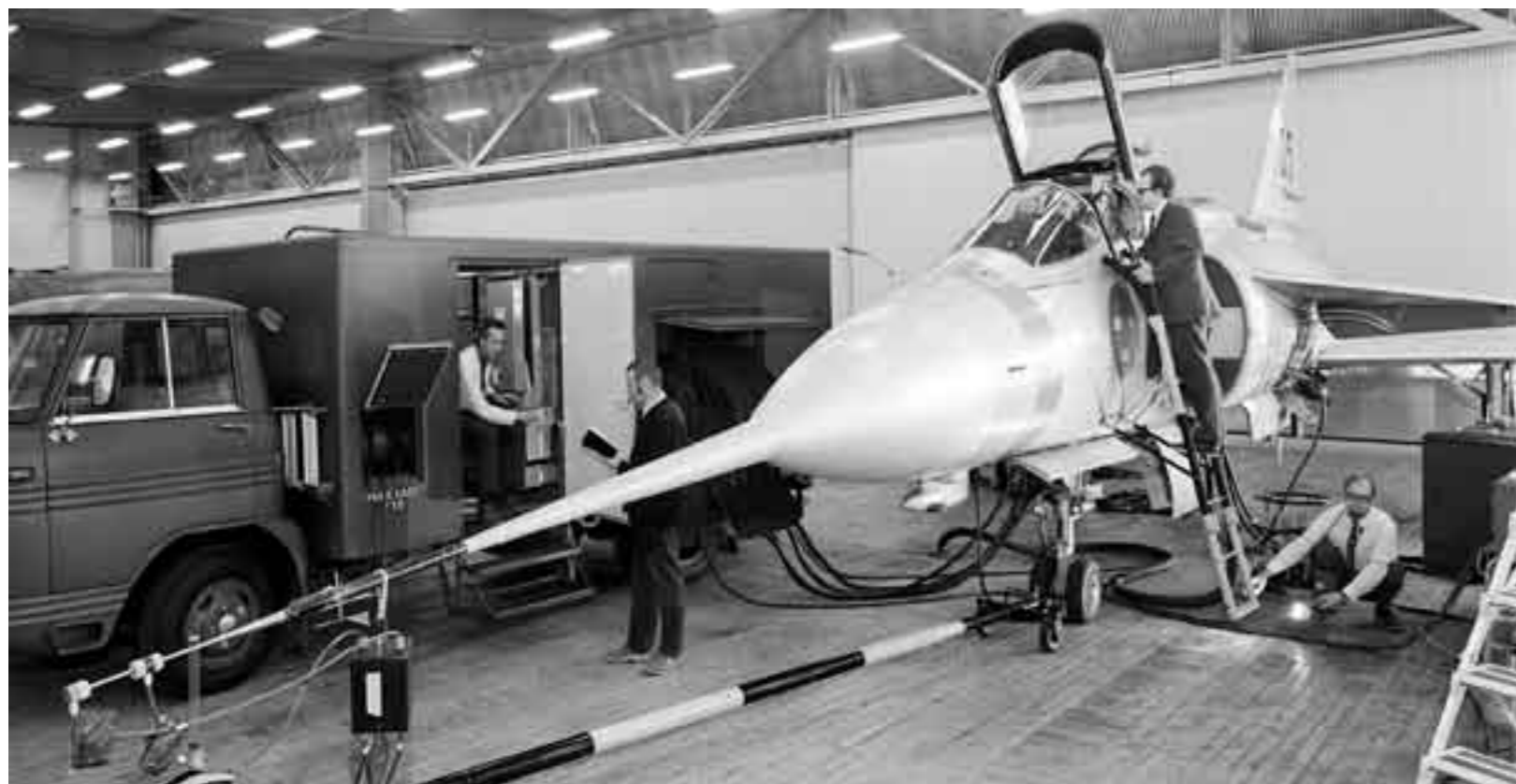
På FMV:s provplats i Linköping har Viggen varit ett dominerande inslag. Med hjälp av teletestbil 037 genomförde man i maj 1970 bland annat tidiga tester av avioniksystemet i AJ 37.