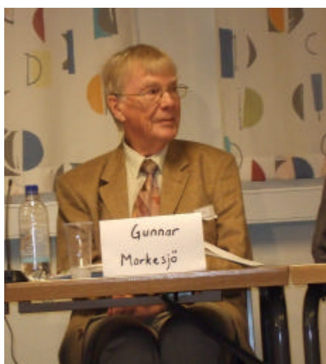
Äldst i panelen