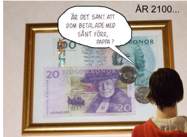
Några bilder från utställningen. Till vänster kaurisnäckor, ett till sen tid använt betalningsmedel i länderna kring Stilla Havet, till höger ett möjligt (men knappast helt säkert) scenario.